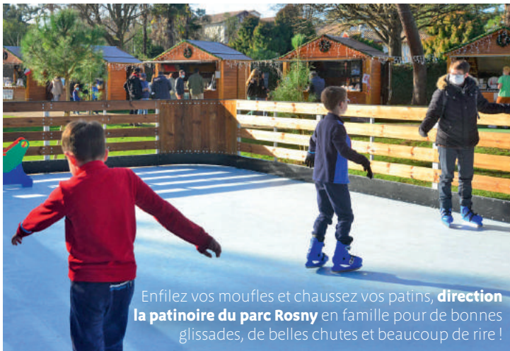
Enfilez vos moufles et chaussez vos patins, direction la patinoire du parc Rosny en famille pour de bonnes glissades, de belles chutes et beaucoup de rire !