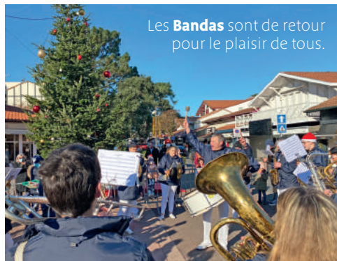
Les Bandas sont de retour pour le plaisir de tous.