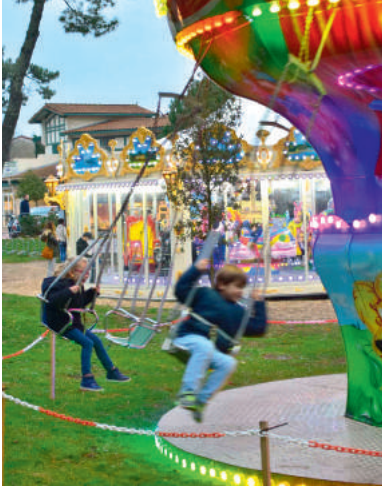
Manèges, spectacles, musiques, un Noël sur mesure pour petits et grands !

Fermez les yeux, un coup de baguette magique et vous voilà sous les flocons dans la forêt enchantée du Père Noël. Pour vivre des fêtes inoubliables c'est à Soorts-Hossegor qu'il fallait passer ses vacances ! Dans cette ambiance féérique, de nombreuses animations pour petits et grands ont été proposées par la municipalité, l'office de tourisme et les commerçants. Une belle façon de créer une dynamique et d'insuffler un air de fête malgré les restrictions gouvernementales liées à la crise sanitaire.